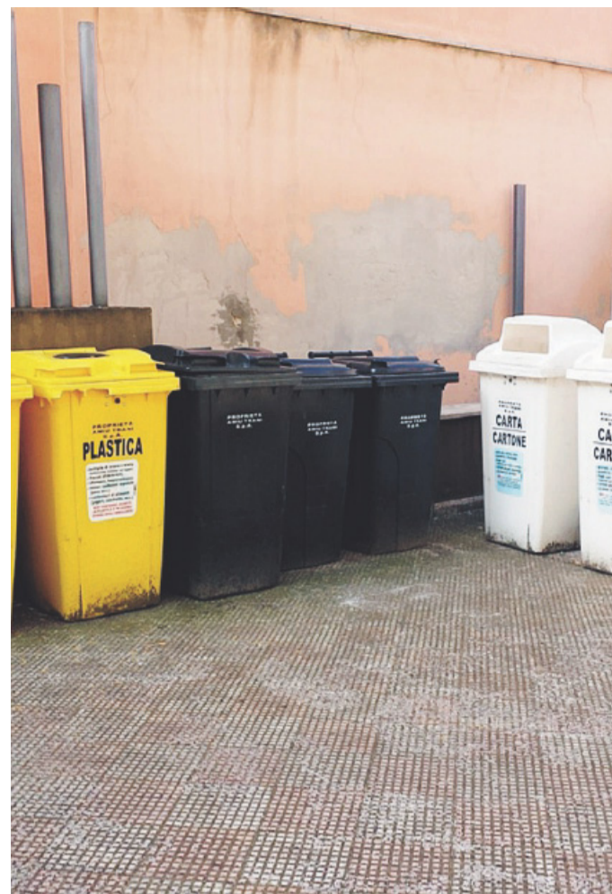
TRANI Bandita la gara per l'acquisto del materiale per il «porta a porta»

Lo startup dei servizi ed il cronoprogramma delle atti-