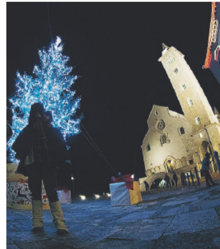
Natale a Trani