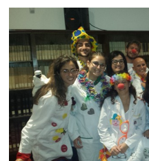
Clownterapia la medic