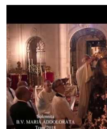
Trani Religiosa Incoronazione Addolorata