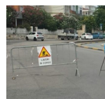
Trani Lavori in Corso