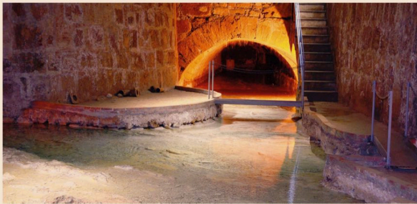
L'opera. Sorgenti dei Gabletti a Palermo, antico "tempio dell'acqua", che ancora rinfonisce l'acquedotto palermitano. In nome "Gabletti" si fa risalire alla parola araba "Al Garbat", che significa getta irrigante.

22,3% Quota dei dipendenti a termine sui dipendenti totali nel Sud | 60% La quota di unità locali del Sud interessate dal primo lockdown | 500 euro Costo pro-capite del primo lockdown al Sud