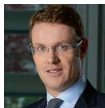
Harald Antley P ASPIAG SERVICE

entrò infatti dal 1° gennaio 2015 in Esd, mentre Despar Servizi affidò a Pam Panorama le attività di negoziazione, svol-