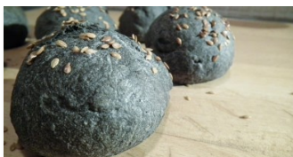
Esito negativo dei controlli sui prodotti da forno con carbone vegetale