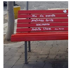
25 Novembre Giornata Violenza contro le don