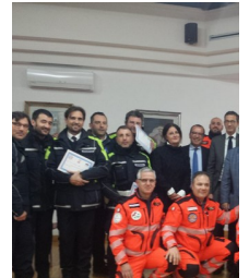
Trani città' Cardioprot