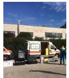
Educazione alla sicure emergenze