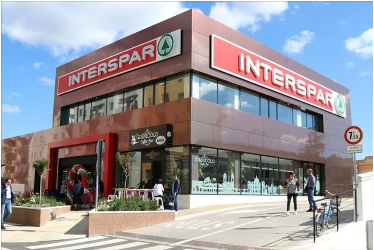
Il supermercato in un "click": Despar centro-sud lancia la spesa on-line

C ontinua la crescita di Despar Centro-Sud, che dopo aver chiuso il 2018 con un fatturato di 805 milioni di giro d'affari complessivo alla casse (+2% sul 2017), conferma il trend di crescita costante degli ultimi anni proiettandosi ad un 2019 di novità, investimenti e assestamento. Protagonista del 2019 è www.desparacasa.it , il nuovo servizio lanciato da Maiora, concessionaria del marchio Despar per il Centro Sud Italia: tutta la qualità dei prodotti presenti nei negozi Despar è trasferita in un vero e proprio supermercato digitale.